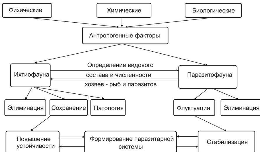
Рис. 2. Действие антропогенных факторов на формирование паразитарной системы (ПС)

численности паразитов, особенно в условиях промышленного производства и аквакультуры, где применяются повышенные концентрации дорогостоящих и малоэффективных лечебных препаратов, не учитывает действие токсикантов.