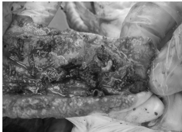
Рис. 2. Клубова кишка поросятя віком 5 місяців: слизова оболонка гіперемована, потовщена, з помірно складчастою поверхнею та кров'яними згустками.

Нами були проведені гістопатологічні дослідження 14 біоматеріалів уражених кишечників від поросят різного віку із 4-х господарств. При цьому найбільш виражені зміни спостерігали у клубовій кишці. У більшості поросят слизова оболонка була потовщена за рахунок розростання крипти і накопичення клітинних проліфератів у власній пластинці слизової оболонки. Характерною ознакою змін в слизовій оболонці була гіперплазія епітелію ворсинок та крипти. У нормі, ворсинки та стінка крипти вистелені простим стовпчастим епітелієм, в якому ядра ентероцитів лежать на одному рівні. У досліджених випадках ми спостерігали, як в результаті проліферації простий стовпчастий епітелій набував вигляду псевдобагатощарового епітелію (рис. 3). У ньому ядра молодих ентероцитів були розташовані у багато рядів, келихоподібні клітини були поодинокими, або зовсім відсутніми. Мітотична активність ентероцитів була значно підвищеною. Просвіт крипти заповнювався молодими ентероцитами (рис. 4) Частина крипти розгалужувалася.